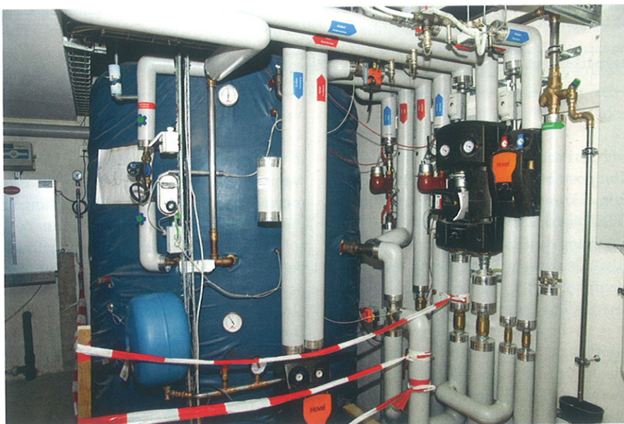
Der 7000-Liter-Warmwasserspeicher; die Wärme stammt vom BHKW, das 1/3 Strom und 2/3 Wärme erzeugt.

Die Insellösung in Wetzwil ist rund 40 Prozent teurer, als wenn das Haus konventionell mit Anschluss ans Strom- und Gasnetz gebaut worden wäre. Allerdings, betont Dieter Zerfass, sei die Amortisation im autarken Haus ungleich grösser, da Abwärme und Energie optimal genutzt würden. Zudem ist in der Zukunft mit stetig steigenden Stromkosten zu rechnen.