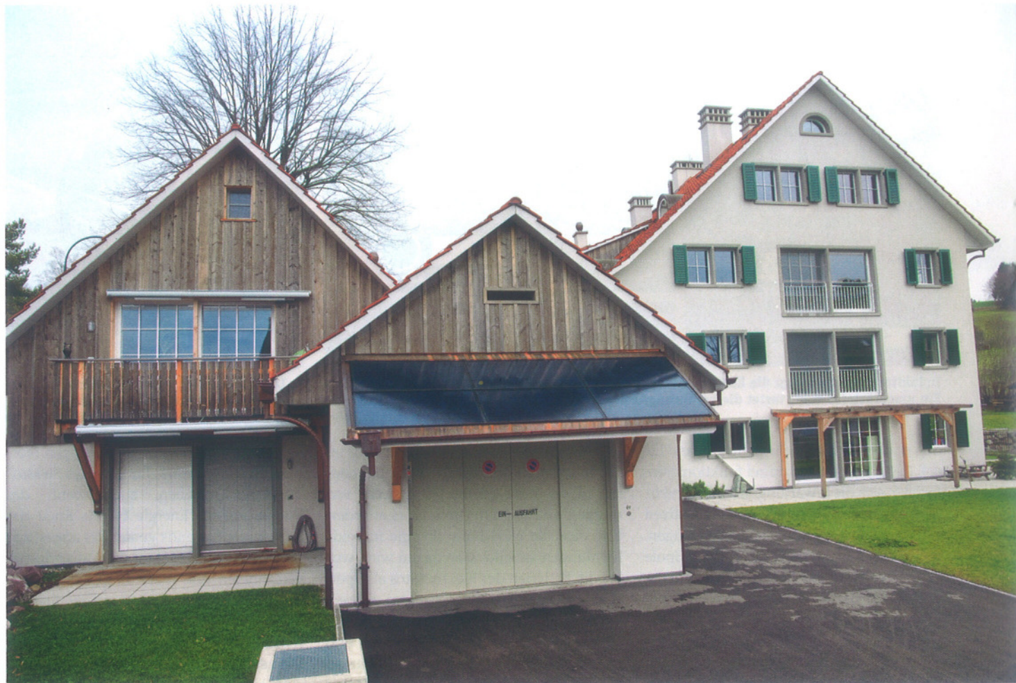
Anwesen in Wetzwil-Herrliberg: Wo einst ein Bauernhof stand, wurde Wohnraum geschaffen – in einem Energie-autarken Haus.