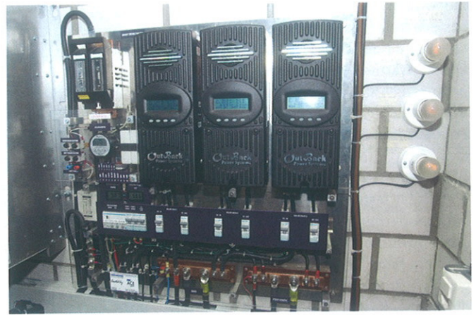
Kernstück der Hauszentrale: Laderegler der PV-Anlage (5,8 kWp) und die 3-Phasen-Wechselrichter (126 KVA max.).

passten Wechselrichtern (3 Phasen 400V/ 50 Herz), um die nötige Betriebsenergie (68 kW) des Autolifts während 20 Sekunden bereitzustellen.