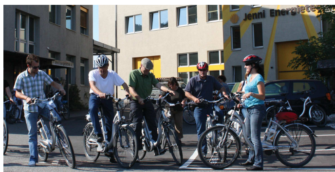
Oben: Chinesische Regierungsdelegation Unten: Gemeinderat Schüpfen Rechts: Studenten SPF Rapperswil