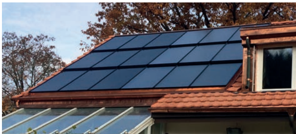
Energiedach mit Photovoltaik-Modulen (links) und thermischen Kollektoren

Unserer Meinung nach ist es sinnvoll, soweit die Wärme verwendet werden kann, zuerst Sonnenkollektoren und nachher, wenn noch geeignete Flächen vorhanden sind, eine Solarstromanlage zu realisieren. Aus dieser Überlegung heraus bauen wir immer häufiger kombinierte Anlagen.