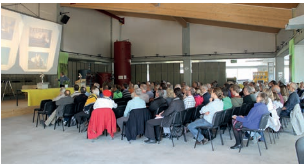
Schulung, Kurse, Vorträge bei Jenni Energietechnik

Seit Jahrzehnten betreibt die Jenni Energietechnik AG Aufklärungsarbeit zur Förderung erneuerbarer Energien wie kaum eine andere Firma. Wir bieten laufend Kurse für Installateure, Planer, Architekten und weitere Interessierte an. Die 2017 durchgeführten Praxiskurse für Handwerker zum Thema «Wie wird eine Sonnenheizung konkret installiert» stossen auf bestes Besucherecho.