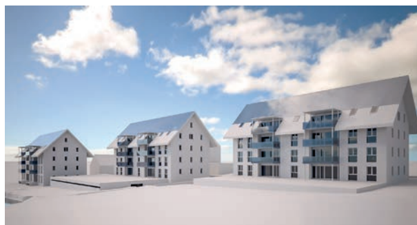
Aktuelles Bauprojekt von Jenni Liegenschaften AG: Solarmehrfamilienhäuser in Huttwil

Viele Kapitalanlagen von der Pensionskasse bis zum Sparkonto finanzieren Projekte, welche zur beschleunigten Plünderung unserer Erde beitragen. Mit der Investition in vernünftig gebaute, vollständig solarbeheizte Mehrfamilienhäuser können wir Ihnen eine Alternative bieten. Neben dem konventionellen Nutzen haben diese Gebäude auch einen Pilotcharakter. Wir wünschen, dass Andere unser Konzept kopieren. Nach den drei ersten Achtfamilienhäusern in Oberburg ist ein nächstes Projekt in Huttwil baubereit. Vor einem Jahr konnten wir das Grundstück erwerben, Anfang September haben wir die definitive Baugenehmigung erhalten und nun können wir ab Anfang 2018 mit dem Bau der Liegenschaften beginnen.