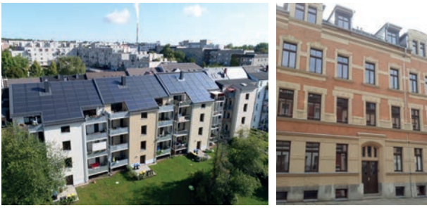
Solarsanierte Mehrfamilienhäuser von 1910 in Chemnitz Süd- resp. Nordfassade

Gerne begleiten wir andere Investoren und Bauherren bei der Realisierung von Solarbauprojekten.