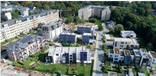
Solarüberbauung Salzstrasse in Chemnitz

Solare Wärme ist ganzheitlich betrachtet die umweltschonendste erneuerbare Energiequelle. Ganz offensichtlich ist dies bei der passiven Sonnenenergienutzung mit guten, richtig angeordneten und sinnvoll benutzten Fenstern. Bereits heute werden über 20 % unseres Heizenergiebedarfs durch Sonneneinstrahlung via Fenster gedeckt. Dieser Anteil kann noch gesteigert werden. Leider tritt diese Tatsache in offiziellen Energiestatistiken nie in Erscheinung. Auch die solare Wärmenutzung mit Sonnenkollektoren für Heizung und Warmwasser – eine relativ einfache Technik – schneidet verglichen mit anderen erneuerbaren Energien besser ab, zum Beispiel in Bezug auf die verwendeten rezyklierbaren Rohstoffe, die Landschaftschonung, den relativ hohen Wirkungsgrad und die Speicherfähigkeit der Energie.