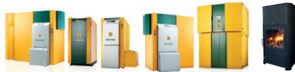
Moderne Holzfeuerungskessel, zeichnen sich durch saubere Verbrennung und hohen Wirkungsgrad aus.

Auf diese Art reicht das Holz problemlos für Alle, als finale Stütze der Energiewende im Wärmebereich.