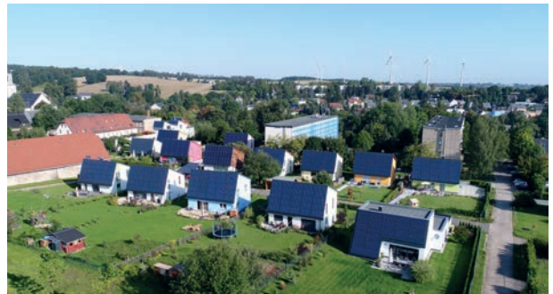
Solarsiedlung Rittergut Rabenstein, Chemnitz

Bei Neubauten kann dank Niedrigenergiebauweise der Energiebedarf für Heizung und Warmwasser mehrheitlich bis vollständig mit der Sonne erzeugt werden. Wird der geringe Restenergiebedarf mit dem erneuerbaren Energieträger Holz abgedeckt, ist das Energieproblem für Heizung und Warmwasser grundsätzlich gelöst.