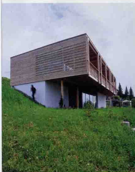
TG-003: Isolierung ist alles. Dann reicht die Körperwärme der Bewohner und die Abwärme der Geräte, um nicht zu frieren.