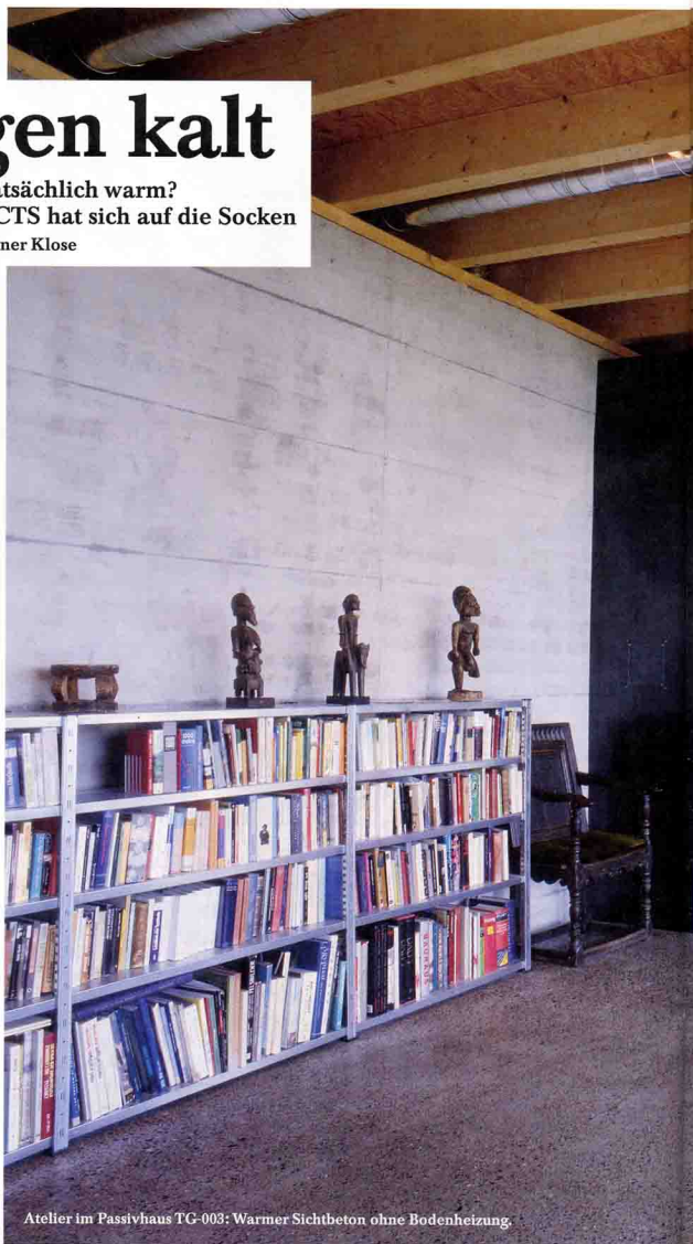
Atelier im Passivhaus TG-003: Warmer Sichtbeton ohne Bodenheizung.

Inzwischen stehen mehr als 6000 Passivhäuser in Deutschland und Österreich – die Schweiz hinkt mit 56 Einfamilien- und 10 Mehrfamilienhäusern hinterher. Der